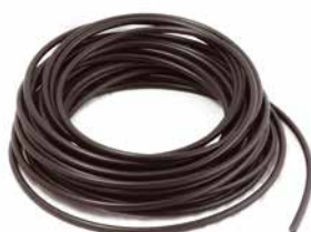
CABO DE VELA 5 MM (EM METROS)

CÓDIGO 90240210 CÓDIGO ORIG 1115-400-2000 APLICAÇÃO motosserra Stihl 08 e motobombas Stihl P835 e 840 (com ignição a platinado)