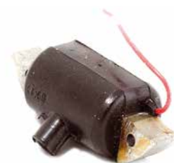
BOBINA DE IGNIÇÃO HAUPT SOLO 635

CÓDIGO 90200650 CÓDIGO ORIG 113143000 APLICAÇÃO motosserra Intertec Dolmar mod. CC e Super CC