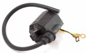
BOBINA DE IGNIÇÃO HUSQVARNA 162

CÓDIGO 90200280 CÓDIGO ORIG 501617201 APLICAÇÃO motosserra Husqvarna 162