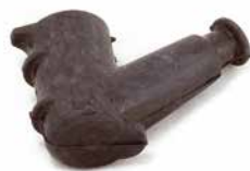
CACHIMBO DE VELA STIHL 340 / 380

CÓDIGO 90230740 CÓDIGO ORIG 1108-400-0510 APLICAÇÃO motosserra Stihl 08 e motobombas Stihl P835 e 840