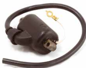
BOBINA DE IGNIÇÃO INTERTEC

CÓDIGO 90200470 CÓDIGO ORIG 674.05520 APLICAÇÃO motosserra Hatsuta B70 e B100