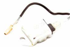
TCI ELETRÔNICO PARA MOTOSSERRA / ROÇADEIRA

CÓDIGO 90245000 APLICAÇÃO motosserras e roçadeiras