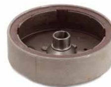
VOLANTE MAGNÉTICO STIHL 070

CÓDIGO 90230670 CÓDIGO ORIG 1108-400-1200 APLICAÇÃO motosserra Stihl 08 e motobombas Stihl P835 e 840 (com ignição a platinado)