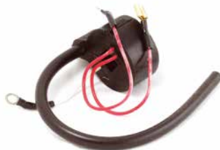
BOBINA DE IGNIÇÃO ALPINA 070

CÓDIGO 90200360 CÓDIGO ORIG 55986-A APLICAÇÃO motosserra Homelite 1050