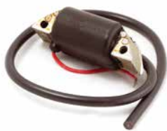
BOBINA DE IGNIÇÃO YANMAR

CÓDIGO 90200610 CÓDIGO ORIG KT-18 APLICAÇÃO pulverizadores Jacto