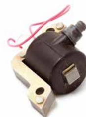
BOBINA DE IGNIÇÃO HAUPT SOLO 620

CÓDIGO 90200280 CÓDIGO ORIG 501617201 APLICAÇÃO motosserra Husqvarna 162