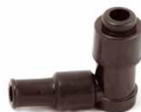
CACHIMBO DE VELA CG UNIVERSAL

CÓDIGO 90250430 APLICAÇÃO motos e motores estacionários