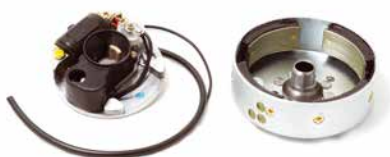
MAGNETO STIHL 08 COMPLETO

CÓDIGO 90230680 CÓDIGO ORIG 1106-400-1202 APLICAÇÃO motosserra Stihl 070