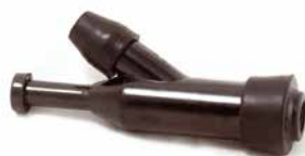
CACHIMBO DE VELA MOTOR ESTACIONÁRIO

CÓDIGO 90250441 APLICAÇÃO motos e motores estacionários