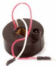
BOBINA DE IGNIÇÃO BRIGGS 298502 - 3HP

CÓDIGO 90200290 CÓDIGO ORIG 291617 APLICAÇÃO motores Briggs