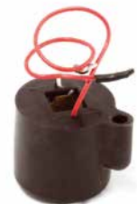
BOBINA DE IGNIÇÃO BRIGGS 291617 - 10HP

CÓDIGO 90200290 CÓDIGO ORIG 291617 APLICAÇÃO motores Briggs