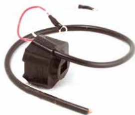
BOBINA DE IGNIÇÃO HOMELITE 1050

CÓDIGO 90200300 CÓDIGO ORIG 23-00-228 APLICAÇÃO motosserra Haupt Tropicon Modelo 620 e 666