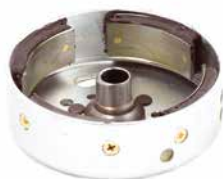
VOLANTE MAGNÉTICO STIHL 08

CÓDIGO 90230670 CÓDIGO ORIG 1108-400-1200 APLICAÇÃO motosserra Stihl 08 e motobombas Stihl P835 e 840 (com ignição a platinado)