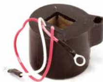
BOBINA DE IGNIÇÃO BRIGGS 296834 - 5 A 8 HP

CÓDIGO 90200340 CÓDIGO ORIG 298502 APLICAÇÃO motores Briggs