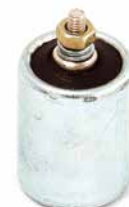
CONDENSADOR STIHL 08

CÓDIGO 90250860 APLICAÇÃO motosserra Stihl 340 / 380