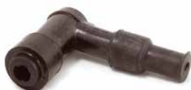
CACHIMBO DE VELA RESISTIVO

CÓDIGO 90250440 APLICAÇÃO motos e motores estacionários