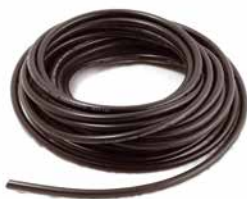
CABO DE VELA 7 MM (EM METROS)

CÓDIGO 90250430 APLICAÇÃO motos e motores estacionários