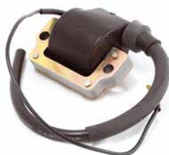
BOBINA DE IGNIÇÃO HATSUTA B70/B100

CÓDIGO 90200450 CÓDIGO ORIG 67164 APLICAÇÃO motosserra Homelite 923