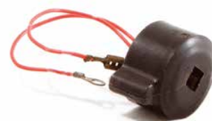
BOBINA DE IGNIÇÃO HOMELITE 923

CÓDIGO 90200420 CÓDIGO ORIG 07013234 APLICAÇÃO motosserra Alpina 070