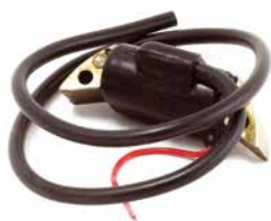
BOBINA DE IGNIÇÃO HATSUTA AM12 BM15

CÓDIGO 90200440 CÓDIGO ORIG 24200160 APLICAÇÃO pulverizador e Atomizador Hatsuta Modelos AM 12 BM 15