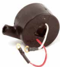
BOBINA DE IGNIÇÃO JOHNSON

CÓDIGO 90200310 CÓDIGO ORIG 580.416 APLICAÇÃO motores Johnson