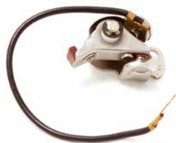
PLATINADO STIHL 08

CÓDIGO 90201311 CÓDIGO ORIG 1115-404-3400 APLICAÇÃO motosserra Stihl 08 e motobombas Stihl P835 e 840 (com ignição a platinado)