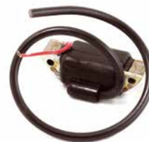
BOBINA DE IGNIÇÃO JACTO

CÓDIGO 90200440 CÓDIGO ORIG 24200160 APLICAÇÃO pulverizador e Atomizador Hatsuta Modelos AM 12 BM 15