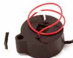
BOBINA DE IGNIÇÃO WISCONSIN

CÓDIGO 90200350 CÓDIGO ORIG 296834 APLICAÇÃO motores Briggs